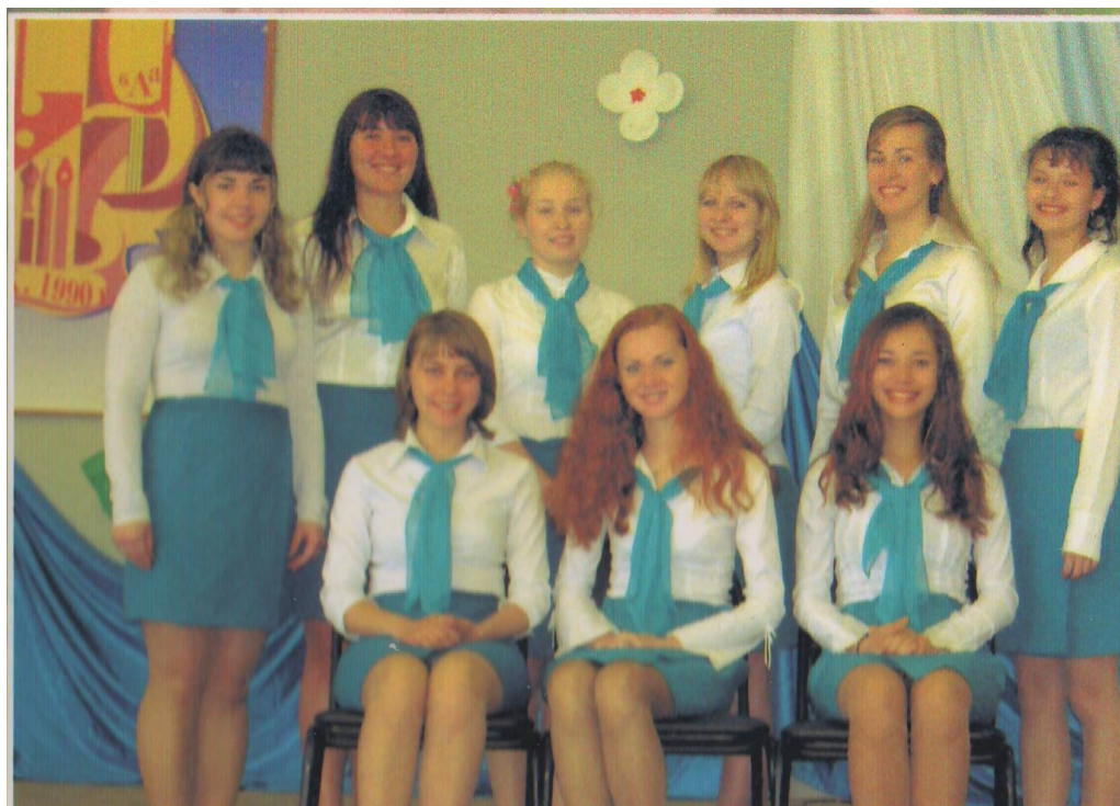
«Вдохновение» образца 2006 г.