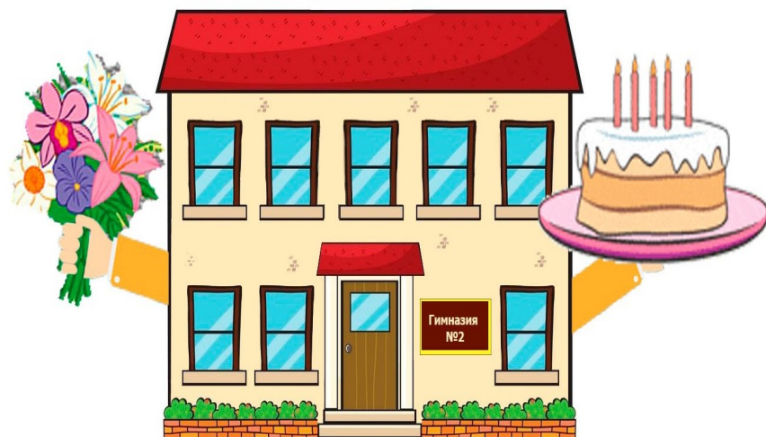
Рис. Даниила Таранова, 10М

Сегодня день особенный, И всем о том скажу! Поздравить с днём рождения Гимназию спешу!