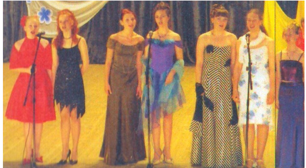
«Погаснут свечи, простимся мы у нашей школы в лучах зари...»