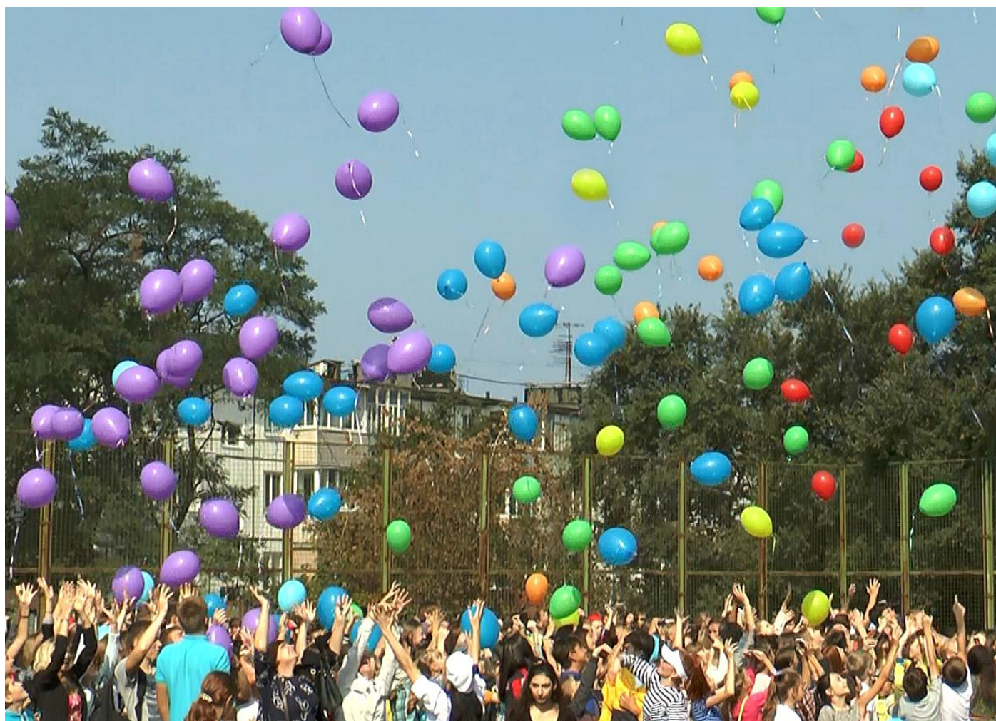
Кульминация празднования 25-летия гимназии.

RSPR-код #2141 Основано в мае 2013 Тираж 5 экз.